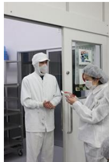
製造工程について インタビュー