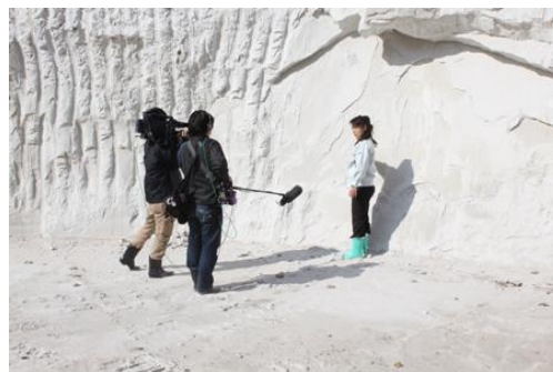
天元限定地層から採取するシラスです。