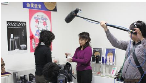
製品についてインタビュー